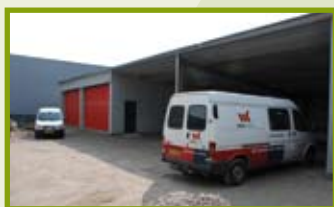
Nieuwe WVK-werf in Bergeijk