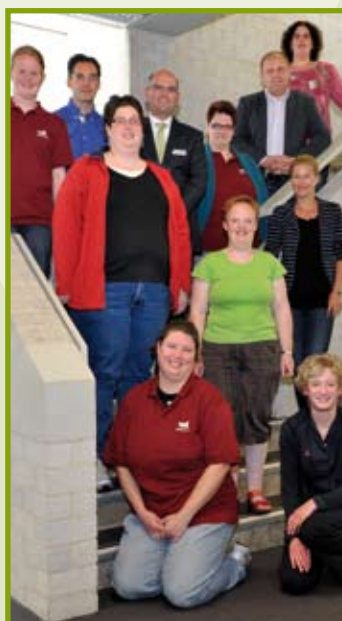
Het facilitaire team van WVK-groep samen met vertegenwoordigers van de gemeente Eersel bij de kick off op 16 mei