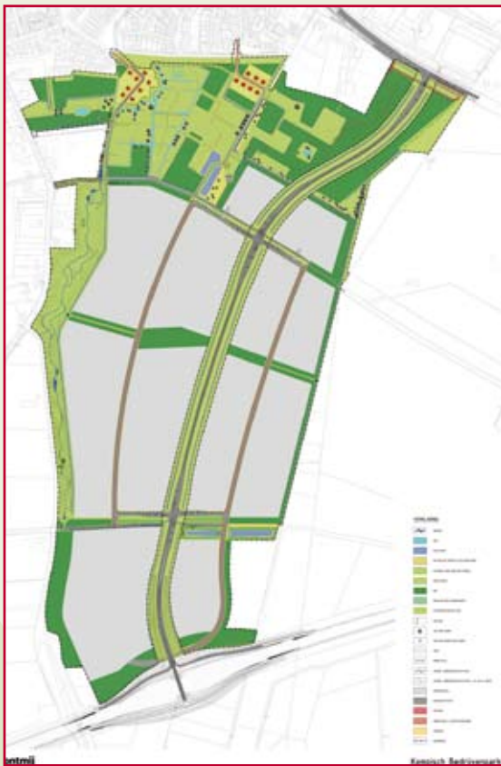
Plankaart van het Kempisch Bedrijvenpark

door de bedrijven wordt uitgestoten. Het streven is die uitstoot volledig te neutraliseren.” En ook de (kostbare) verplaatsing van drie grote kastanjebomen ziet hij als een maatregel in het kader van de duurzaamheid. Het zijn dit soort keuzes die het KBP tot zo'n bijzonder project maken, zegt Gjalt. “Vroeger ging het alleen om betaalbaarheid, nu is de leidende gedachte: er moet een mooi park komen waar prettig gewerkt kan worden. Met die aan-