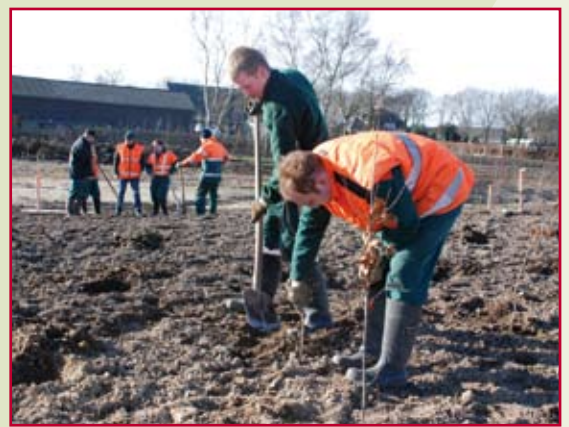
WVK-groenwerkers bezig met de aanplant

Zo kon het gebeuren dat vanaf het najaar van 2010 met enige regelmaat groepjes groenwerkers van WVK-groep konden worden aangetroffen op het terrein van het KBP, druk in de weer met het aanplanten van allerlei inheemse bomen en planten, zoals eik, jeneverbess, hazelaar, krent, prunus en rozenbottel. Dat werk wilde overigens niet altijd even goed vlotten. Door de sneeuwrijke decembermaand kon het grondwerk niet tijdig worden afgerond, waardoor ook het plantwerk verder naar achter moest worden doorgeschoven. Later volgden een paar erg natte maanden en ook die leverden vertraging op. Desondanks is al zestig procent van