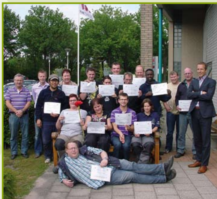
Trots tonen de medewerkers hun certificaat