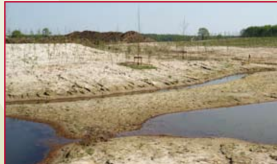
De ecologische zone waar een beekje doorheen stroomt

Op het Kempisch Bedrijvenpark is WVK-Groenvoorziening verantwoordelijk voor de aanplant van 150.000 bomen en planten. Een project dat de WVK-groenwerkers helemaal op het lijf geschreven is. Men kan er zijn vakmanschap in kwijt, er is een prettige samenwerking met de opdrachtgever en er liggen interessante mogelijkheden voor de toekomst.