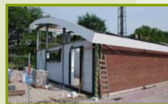
Nieuwe WVK-werf in Eersel