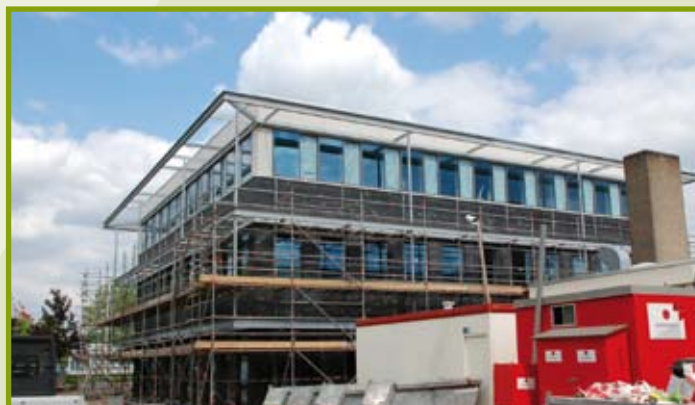
Nieuwe pand vestiging Hallenstraat