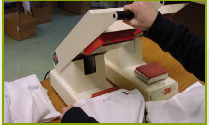
Het patchen van het linnengoed

uitpakken van de artikelen en deze na behandeling weer verzendklaar maken tot het takenpakket van de gedetacheerden. HeboVanDijk is erg enthousiast over de groepsdetachering en gaat bekijken of deze constructie in de toekomst vaker kan worden ingezet.