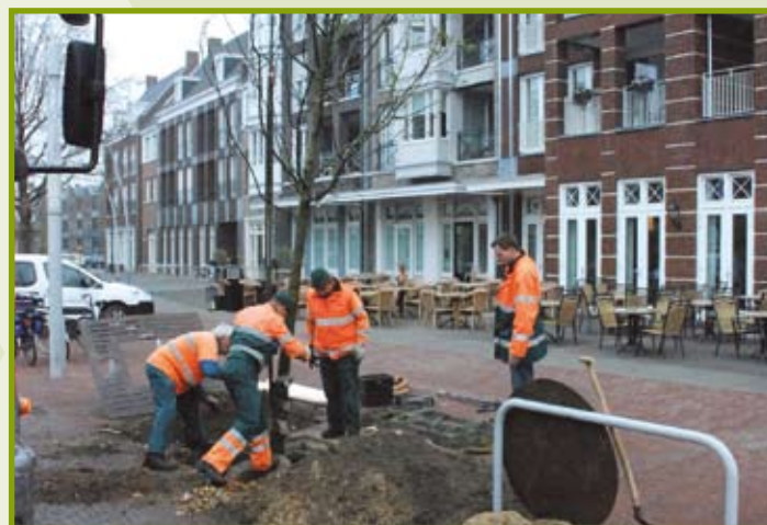
Bomen planten op de Markt in Bladel

Op de Markt in Bladel is het centrumplan Marktstaete, een bouwproject dat voorziet in een zestigtal appartementen en tal van winkels en horecagelegenheden, nagenoeg volledig voltooid. Bij de finishing touch was nog een speciale rol weggelegd voor WVK-groep. Medewerkers van de Groenvoorziening team Bladel plantten er twee exclusieve bomen, de zogenaamde fraxinus excelsior , ofwel de Hollandse es. Bij het planten moest uiterst zorgvuldig te werk gegaan worden, want de bomen zijn (met een diameter van 30 tot 35 centimeter) al erg groot. Overigens: ook in een ander opzicht is WVK-groep regelmatig actief op de Markt in Bladel: elke week op woensdag worden door WVK-medewerkers de marktkramen klaargezet en weer opgeruimd.