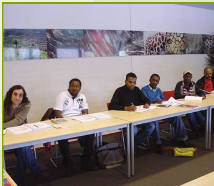
Zes deelnemers van de cursus Nederlands

Zo'n vijftien allochtonen die vanuit landen als Iran, Somalië, Congo en Mongolië in de Kempen zijn neergestreken, hebben in de laatste drie maanden van 2011 bij WVK-groep een cursus Nederlands als tweede taal gevolgd. De cursus, bestaande uit ongeveer vijftig ochtendbijeenkomsten, werd gegeven door een docente van het ROC. Vanwege het verschil in taalniveau werd de groep in de loop van de cursus in twee kleinere groepen gesplitst. Verscheidene cursisten zijn tevens verbonden aan KansActief, het project van ISD de Kempen en WVK-groep dat mensen met een afstand tot de arbeidsmarkt leert om (opnieuw) arbeidsritme op te doen. De cursus Nederlands wordt betaald door ISD de Kempen en is tot stand gekomen mede op initiatief van WVK-vertrouwenspersoon Cor van Baalen, die actief is in Vluchtelingenwerk Nederland.