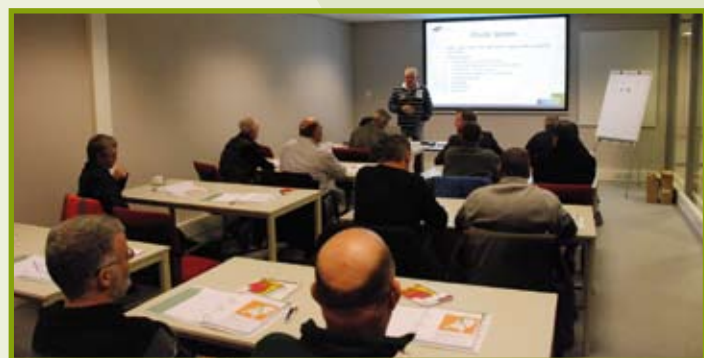
Cursus in het nieuwe instructielokaal