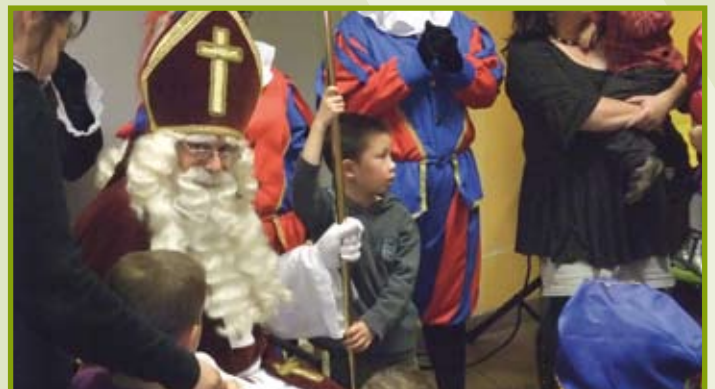
Sinterklaas tussen de WVK-kinderen

Traditiegetrouw bracht Sinterklaas ook dit jaar een bezoek aan WVK-groep. Op vrijdag 18 november verscheen hij in de kantine van de Raambrug, waar een zestigtal kinderen en een veertigtal 'WVK-ouders' hadden plaatsgenomen. De bijeenkomst – die opende met een optreden van het clownsduo Bob en Bella – kende een uitermate plezierig verloop. Vooral natuurlijk voor de kinderen; die gingen met een mooi presentje naar huis.