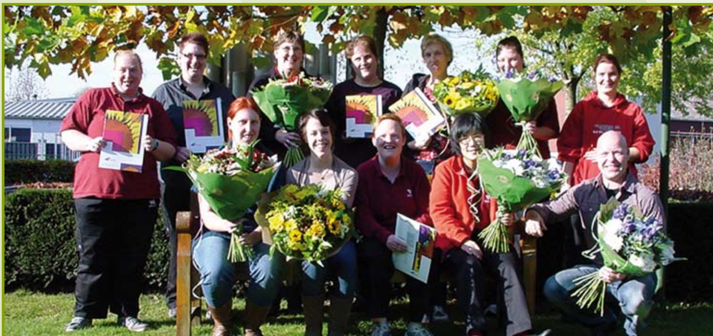
De gediplomeerde schoonmakers