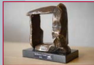
Het Bronzen Venster, prijs voor sociaal ondernemen

Het is wenselijk dat dit percentage toeneemt.