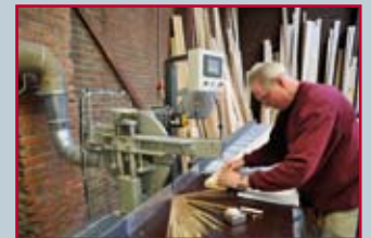
Doel: meer werkplekken bij bedrijven creëren