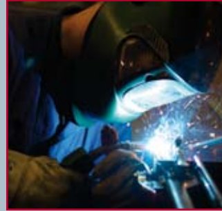
Ook voor laswerk worden WVK’ers ingezet

stand. Kijk, als ik een engineer nodig heb voor onze hoogwaardige metaalbewerking, dan ga ik echt niet naar WVK-groep. Maar voor eenvoudig montage- en aflakwerk is het een geschikt adres. Je krijgt medewerkers met inzet die bovendien trouw zijn aan de taak waar ze voor staan.”