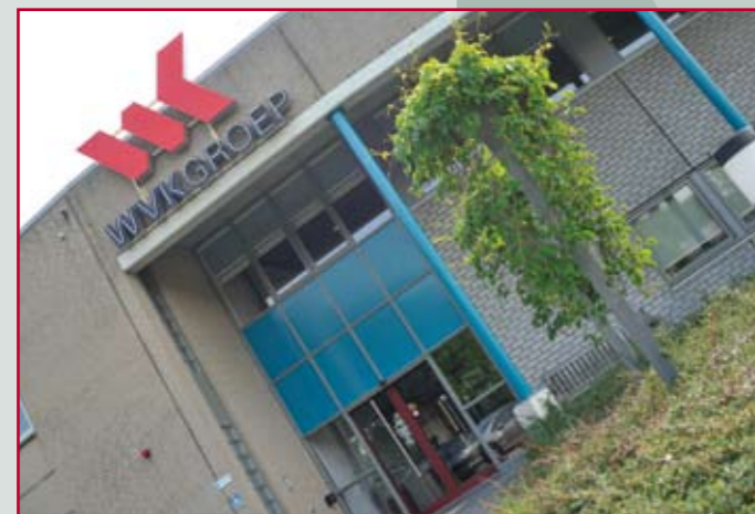
ISD de Kempen en WVK-groep. Zullen zij samengaan of worden ze deel van een nog groter geheel?

Verscheidene groepen uit onze samenleving kunnen zonder steun van de overheid geen werk vinden. Denk aan mensen met een beperking, bijstandsgerechtigden en jonggehandicapten. Voor al deze mensen zijn uiteenlopende sociale wetten gecreëerd: Wsw, WWB en Wajong. Verder hebben we diverse instellingen in het leven geroepen die deze wetten uitvoeren, zoals WVK-groep, ISD de Kempen en UWV.