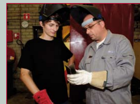
Jongeren in een trajectbegeleiding van het JWG

ISD, UWV en WVK om werkloze jongeren via een speciaal begeleidingsprogramma aan een baan te helpen. Het project, dat na de kredietcrisis van 2008 werd opgezet, kent een bijzonder succesvol verloop. Allereerst is er een mooi rechtstreeks resultaat: tientallen jongeren vonden een baan dankzij een re-integratietraject vanuit het JWG. Daarnaast is de 'bijvangst' interessant: doordat de doelgroep nauwlettender in de gaten werd gehouden wat betreft hun sollicitatieactiviteiten, besloten heel wat jongeren om zelf werk te zoeken. Al met al vonden in een paar jaar tijd vele tientallen Kempische jongeren dankzij het JWG een baan.