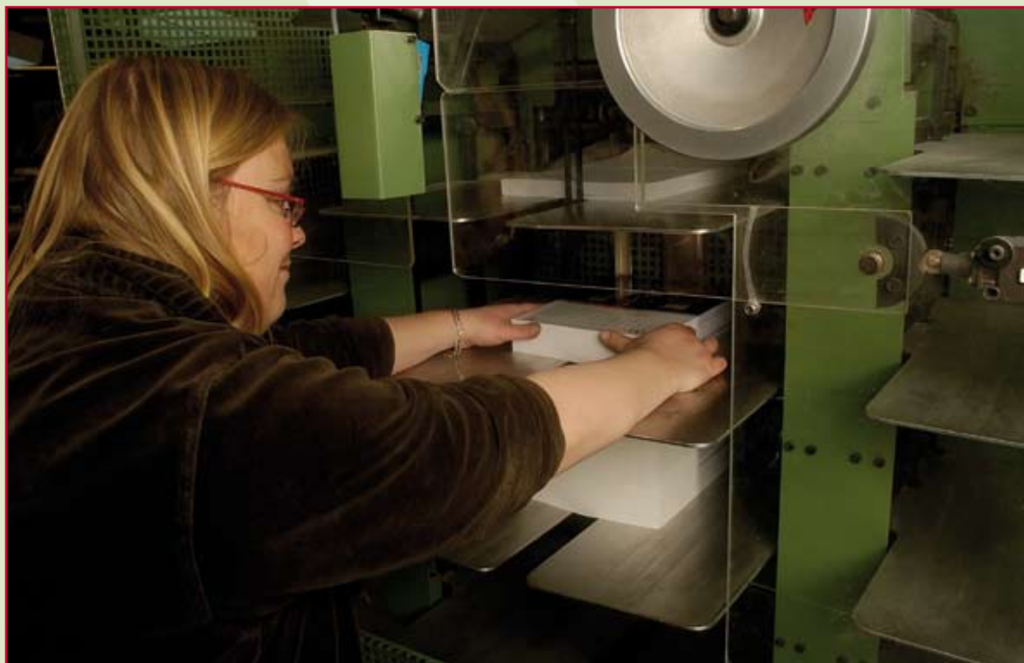
Verhoging van de efficiency is een belangrijk doel voor 2011